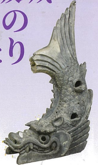
乾櫓鯉瓦(大阪城天守閣蔵)