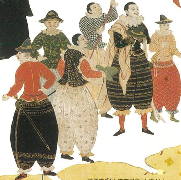
重要文化財 南蛮屏風(右隻より) (大阪城天守閣蔵)