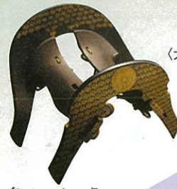
菊桐文蒔絵鞍 (大阪城天守閣蔵)