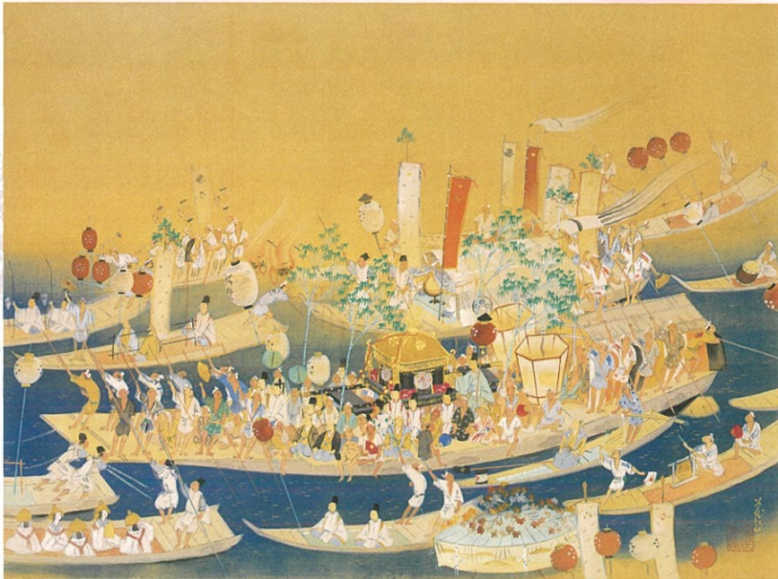
浪速天神祭(大阪城天守閣蔵)