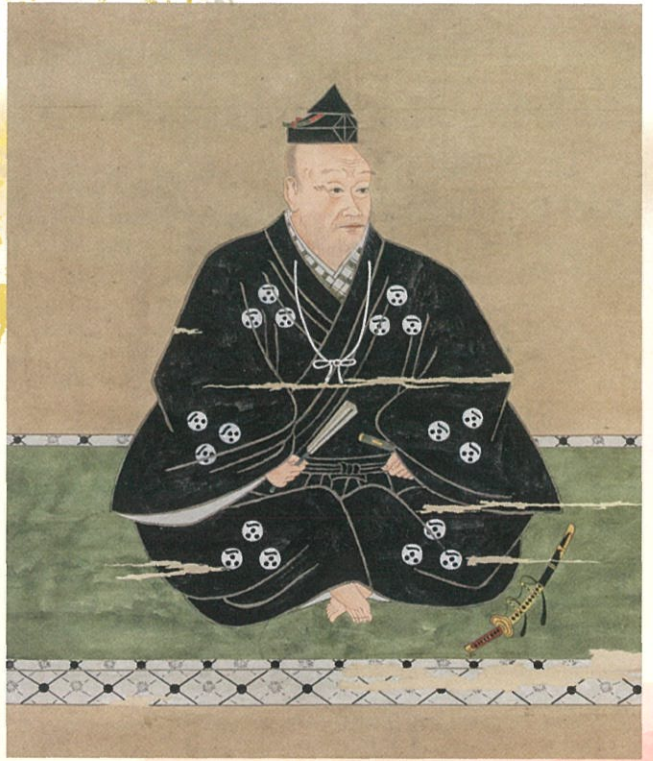
毛利元就画像(大阪城天守閣蔵)